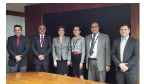
Visita de representantes del CCPACR a la Contraloría General de la República. Fueron recibidos por la Licda. Marta Acosta, Contralora General de la República.

Esta defensa también ha involucrado reuniones con jefes de SUGEF, con los cuales trabajamos de la mano en el tema de la modificación de artículos relacionados con la Ley 8204, y que no se involucraran a todos los CPA en el registro SUGEF.